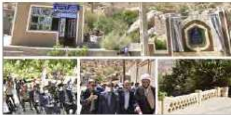
بهره برداری از سازه آبخیزداری در شهرستان بشرویه

بهره برداری از سازه آبخیزداری حوزه غنی آباد شهرستان بشرویه به عنوان طولانی ترین سازه آبخیزداری خراسان جنوبی در پنجمین روز هفته دولت با حضور استاندار خراسان جنوبی به بهره برداری رسید. استاندار خراسان جنوبی در پنجمین روز هفته دولت به همراه معاون عمران روستایی بنیاد مسکن انقلاب اسلامی برای افتتاح و کلنگ‌گذاری پروژه‌های هفته دولت به شهرستان بشرویه سفر کرد. افتتاح و کلنگ‌گذاری همزمان ۳۱ پروژه گازرسانی، بهره‌برداری همزمان از آسفالت معابر ۱۱۳ روستای خراسان جنوبی در روستای خداآفرین، بازدید از طرح‌های روستاها و پروژه پلاند دوم بشرویه به سه راسی بشرویه از برنامه‌های این سفر یک‌روزه بود. برنامه‌های سفر استاندار خراسان جنوبی به شهرستان بشرویه جهت افتتاح و کلنگ‌گذاری پروژه‌های هفته دولت، با اقامت در هتل ماسخ شهدا آغاز شد.