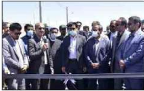
فرماندار شهرستان سریشه، سرپرست فرمانداری شهرستان خوسف و جمعی از مدیران استانی انجام شد. مجتمع بیدمشک با داشتن ۲۴۰ هزار فلفله مرغ تخم گذار و رسته سوم تولید تخم مرغ استان را از آن خود کرده و سهم قابل توجهی در صادرات تخم مرغ از خراسان جنوبی دارد. این مجتمع با ظرفیت ۱۵ تن شیر تولید می کند و کارخانه فرآوری شیر این مجموعه با ظرفیت فنی روزانه ۱۰ تن فلفل است. زمینه لازم برای پرورش و نگهداری گوسفند داشتی و پرورشی با ظرفیت ۵۰۰ رأس نیز در این مجتمع میسازد. مجتمع بیدمشک هم اکنون با ۴۰ هکتار سطح زیرکشت محصولات زراعی و حدود ۸۰ هکتار سطح زیر کشت محصولات باغی شامل پسته، زرشک، فلفله و نیز گل محمدی شرایط خاص و منحصر به فردی ایجاد کرده است. در این مجموعه پروژه آبیاری نوین کم فشار و پر فشار در سطح ۹۸ هکتار اجرایی شده است. گلخانه ۹ هکتاری این مجتمع که با اعتبار ۱۰۰ میلیارد تومان در حال اجراست، یکی از بزرگترین گلخانه های شرق کشور به شمار می آید که در ماه های آینده به بهره برداری خواهد رسید.