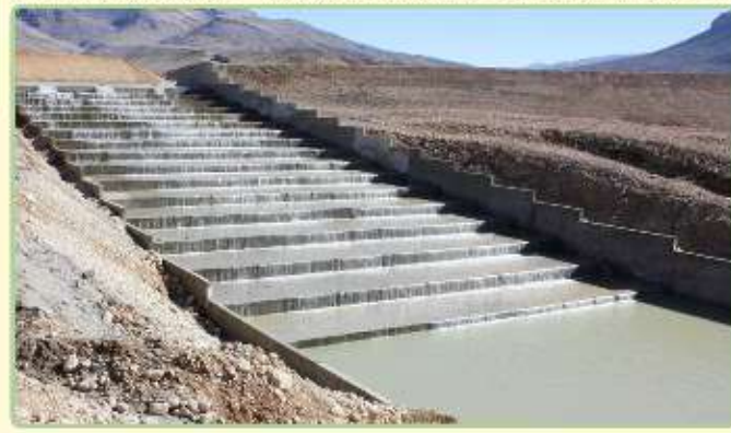
۱۸ پروژه با اعتبار ۲۲ میلیارد تومان در هفته دولت

منابع طبیعی، در یک سال گذشته از مدیریت کل ۲۲۰ میلیون تومان اعتبار تخصیص اعتبارات ویژه در حوزه آبخیزداری باعث رونق مجدد نهضت آبخیزداری در خراسان جنوبی شد. تا جایی که با تصویب ۱۶۰ میلیارد تومان در این حوزه و تخصیص ۹۶ میلیارد تومان از این اعتبار ۴۶ حوزه تحت پوشش قرار گرفت. مدیریت کل منابع طبیعی و آبخیزداری خراسان جنوبی با اعلام این مطلب در نشست خبری معرفی پروژه های قابل افتتاح هفته دولت ۱۴۰۱ گفت: سال گذشته در بخش های مختلف حوزه منابع طبیعی و آبخیزداری استان اقدامات خوبی برای کاهش مضرات خشکسالی، کاهش فرسایش خاک و حفاظت از عرصه های منابع طبیعی انجام شده ... مشروح در صفحه ۶